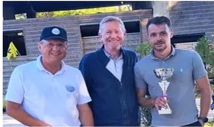
2) Drome Provençale 3 ) V.S.D.